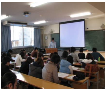
写真 11 共同研究概要発表

午後1時から、研究棟2階の教室で浅野ゼミ3回生の共同研究発表会を行った。朝鮮大学の学生約20人が参加したほか、朝大学生と交流を続けている東京国際大学、慶應義塾大学、早稲田大学、多摩美術大学の学生で組織する「日朝学生ネット」のメンバー数人も参加した。