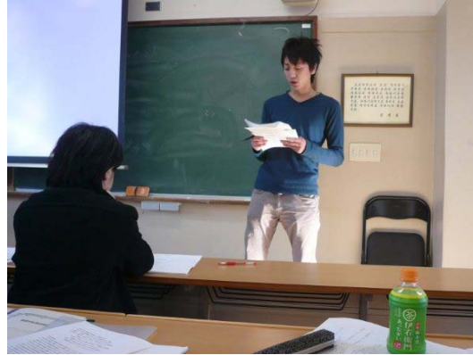
写真 15 共同研究概要発表 2