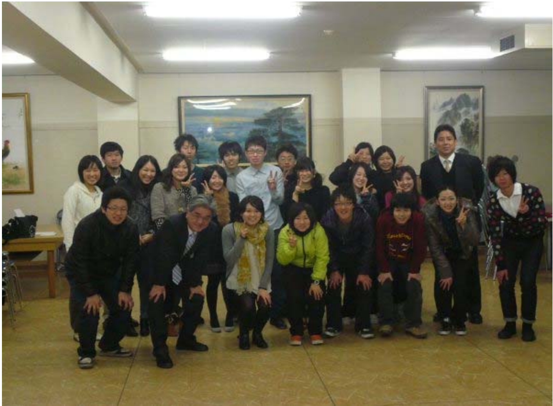
写真 16 朝鮮大学校にて集合写真