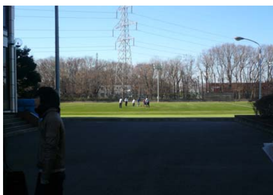
写真 12 校庭

浅野教授は2日間の発表・討論を総括して、「ジャーナリズムの現状分析と改善の方法を模索するために刺激的な討論が展開された。参加したゼミ学生にとって今後の学生生活を送る上で重要な経験になったと確信する。期末試験直前の多忙な時期に受け入れてくれた早大、朝大のみなさんに心より感謝したい」と述べた。