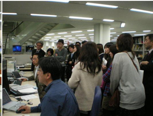
写真 9 写真編集の様子