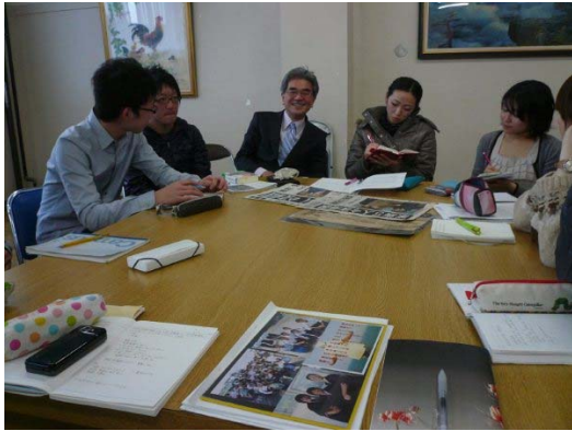
写真 14 グループディスカッション 2