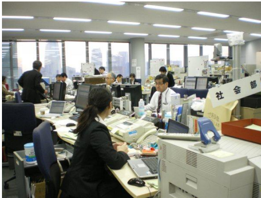
写真 8