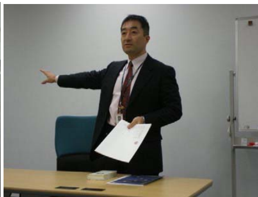
写真7 共同通信社についての説明