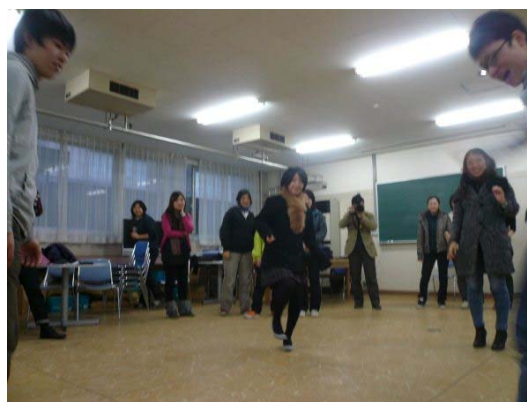
写真 13 民族遊戯「チェギチャギ」